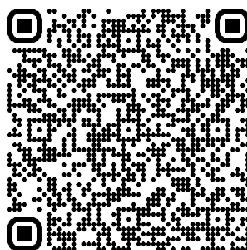
Ich-Flyer Arbeitswelt