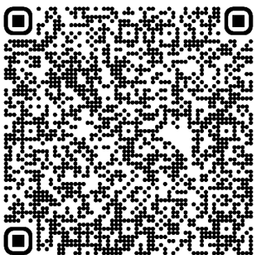
Broschüre für Arbeitgeber*innen