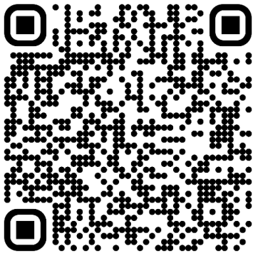
Das Autismus-Spektrum (Broschüre)