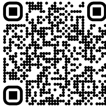
Autismus-Spektrum-Störungen – Das Wichtigste in Kürze